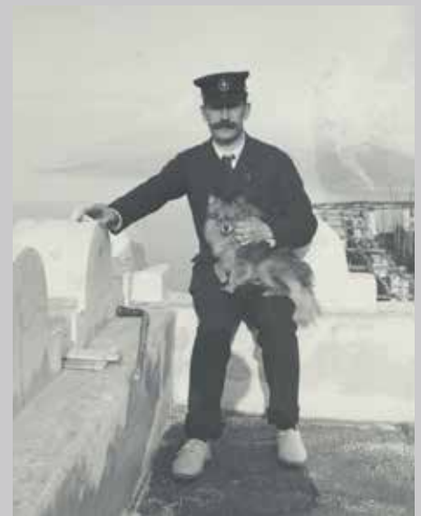
Prinz Max von Baden auf Capri, ca. 1901.

Mit über 8.000 Bildern zählt die Sammlung zu den bedeutendsten fürstlichen Foto-Beständen in öffentlichem Besitz in Deutschland. Seit letztem Jahr ist dieser außergewöhnliche Bestand (LABW, GLAK 69 Baden, Salem-19) für die historische Forschung und interessierte Öffentlichkeit über ein Online-Findmittel nutzbar. Inhaltlich umfasst die Sammlung repräsentative und private Auf-