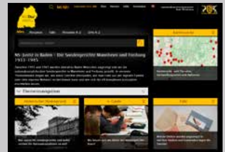
Startseite des Themenmoduls »NS-Justiz in Baden«.