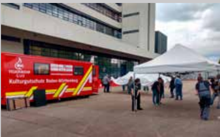
Die Jahresfortbildung des Instituts für Erhaltung von Archiv- und Bibliotheksgut zum Notfallmanagement stieß auf große Resonanz.

Das Institut für Erhaltung von Archiv- und Bibliotheksgut am Standort Ludwigsburg veranstaltete im Juli in Kooperation mit der Staatlichen Akademie der Bildenden Künste Stuttgart die Jahresfortbildung zum Thema Notfallmanagement – von der Entwicklung bis zur Bewältigung . Das Programm bot praxisnahe Einblicke in den Schutz und die Rettung von Kulturgütern bei Notfällen. Experten aus Archiven, Restaurierung und Kulturgutschutz berichteten über Erstversorgung bei Havarien, den Einsatz des Abrollbehälters Kulturgutschutz Baden-Württemberg sowie moderne Techniken wie die Gefriertrocknung. Zudem wurden Erfahrungen aus realen Einsätzen, etwa 2021 im Ahrtal, geteilt. Die Fortbildung stellte die Bedeutung eines effektiven Notfallmanagements für die Bestandserhaltung im Landesarchiv heraus, um das kulturelle Erbe nachhaltig zu sichern. Praktische Hilfsmittel und innovative Restaurierungsprojekte rundeten das Programm ab und förderten den Austausch zwischen Fachleuten (siehe hierzu Beitrag im Heft auf S. 55).