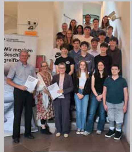
Schülerinnen und Schüler des Deutschorden-Gymnasiums Bad Mergentheim bei ihrem Besuch im Staatsarchiv Wertheim anlässlich der Unterzeichnung der Bildungspartnerschaft.

die Bauern im Krieg von 1525 . Sie fokussierte zentrale Vorgänge um den Bauernkrieg mit besonderer Bedeutung für Württemberg. Im Mittelpunkt stand das gespannte Verhältnis zwischen Herzog Ulrich von Württemberg und den Bauern, das für die dynamische Entwicklung der gewaltsamen Auseinandersetzungen prägnant war. Die rund 2.800 Besucherinnen und Besucher der Ausstellung, der mehrfach aufgelegte Ausstellungskatalog und die wissenschaftliche Resonanz zeigen das große Interesse am Thema und seiner Präsentation.