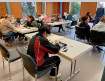
Schulgruppe beim Aktenstudium im Generallandesarchiv Karlsruhe.

Die Abteilung Generallandesarchiv Karlsruhe bewahrt rund 12.000 Akten des NS-Sondergerichts Mannheim. Deren Potential zu heben, um es für die pädagogische und politische Bildungsarbeit zu nutzen, war das Ziel des gemeinsamen Projekts Denun-