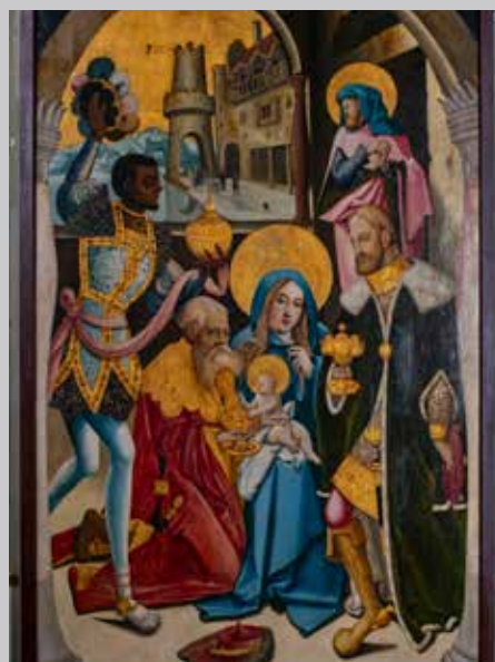
Altartafel »Anbetung der Heiligen Drei Könige« von Jörg Ratgeb, um 1520.

Bereits seit zwei Jahrzehnten bietet das Staatsarchiv Wertheim für Schulen ein spezielles archivpädagogisches Angebot an: quellenkundliche Übungen anhand von Originaltexten zu zentralen Themen des Bildungsplans. Schulen können so passgenau zum Unterricht den Besuch einplanen. Im Mittelpunkt der Projektarbeit stehen die Erforschung der Regionalgeschichte, deren Einordnung in größere historische Zusammenhänge sowie der kritische Umgang mit den Originalquellen. Nach regelmäßigen Besuchen unterschiedlichster Klassen und Oberstufenkurse des Deutschorden-Gymnasiums Bad Mergentheim, die durchweg begeistert waren, reifte die Idee einer Verstärkung der Zusammenarbeit. Im Juli 2025 haben beide Einrichtungen offiziell eine Bildungspartnerschaft geschlossen. Eine Weiterentwicklung der Kooperation ist bereits geplant.