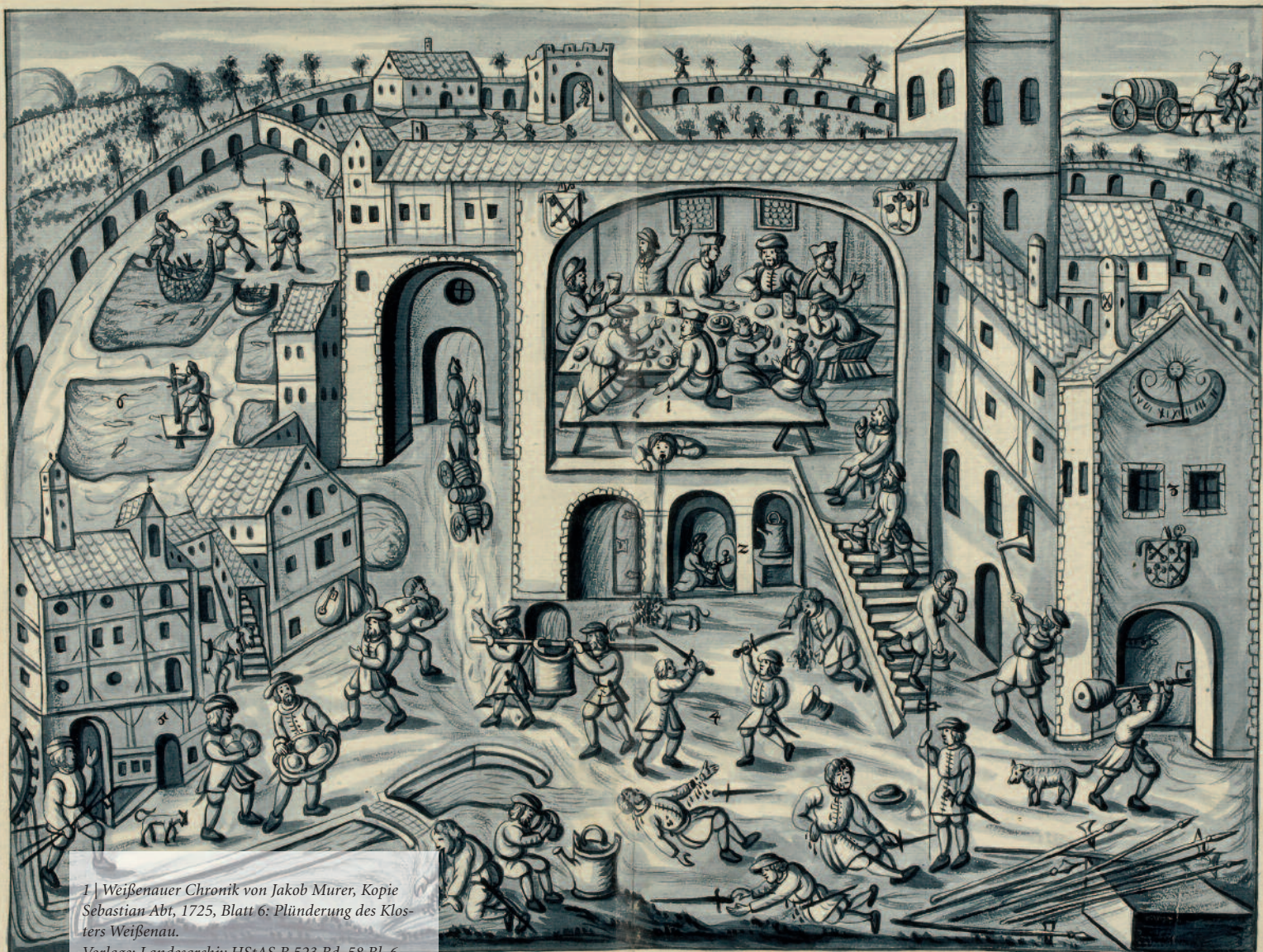
1 | Weißenauer Chronik von Jakob Murer, Kopie Sebastian Abt, 1725, Blatt 6: Plünderung des Klosters Weißenau.

und der Bäckerei, da zu nehmen, was ihnen gefiel, mit Fischen, führen und tragen aus dem Kloster Frauen und Männer, Wein und Brot. (Abb. 1).