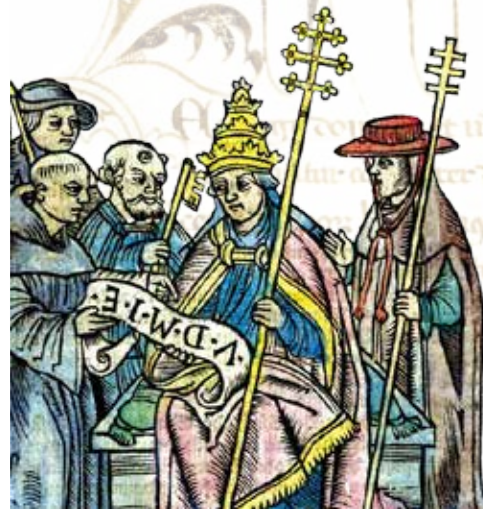
Holzchnitt mit Luther und Papst

Der Einfluss Martin Luthers im deutschen Südwesten und gerade in Württemberg wird intensiv beleuchtet. Die Bannandrohungsbulle des Papstes steht dabei für seinen Bruch mit der römischen Kirche. Die frühe Verbreitung seiner Bibelübersetzung, seiner Schriften und Bilder lassen die „Verehrung“ des Reformators auch im deutschen Südwesten bald erkennen.