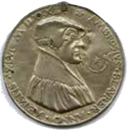
Medaille auf den Reformator Ambrosius Blarer

In Maulbronn stehen besonders die drastischen Auseinandersetzungen um die Reformation zwischen Konvent und Landesherren im Fokus. Das Kloster Bebenhausen gewährt einen intensiven Blick in das geistliche Leben und die Veränderungen der Glaubenswelt durch die Reformation. Alpirsbach bietet die Möglichkeit, dem einstigen Mönch und späteren Reformator Württembergs Ambrosius Blarer bei seiner Suche nach der Glaubenswahrheit zu folgen.