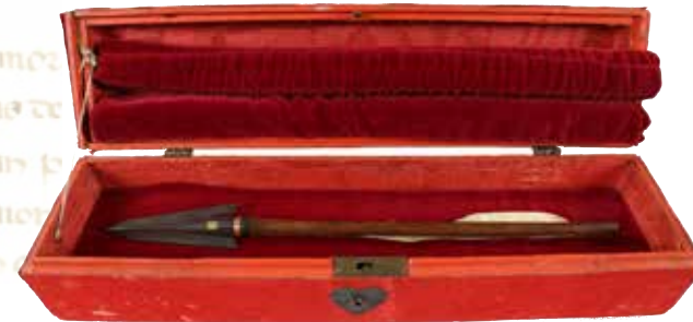
Der Sebastianspfeil aus dem Kloster Bebenhausen

Die ehemaligen Zisterzienserklöster Maulbronn und Bebenhausen sowie das Benediktinerkloster Alpirsbach sind als markante Ausstellungsorte Schauplätze des gemeinsamen Programms. Diese von Herzog Ulrich nach 1534 säkularisierten württembergischen Klöster bieten als herausragende „Reformationsorte“ den authentischen Rahmen zur Darstellung der Ereignisse vor Ort. Ihre jeweilige Geschichte lässt beispielhaft die gewaltigen Umbrüche und Veränderungen in den geistlichen Lebens- und Glaubensvorstellungen aufzeigen, welche mit der Aufhebung der Klöster einhergingen.