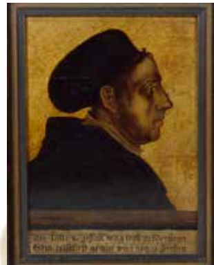
Portrait Martin Luthers

Die zentrale Ausstellung in Stuttgart widmet sich besonders der aufregenden Frühzeit der Reformation im Herzogtum Württemberg. Wie kamen reformatorische Gedanken nach Württemberg, wie wurden sie von der Bevölkerung aufgenommen und welche Veränderungen fanden mit der Einführung der Reformation hier statt? Dabei wird vor allem das Streben der Zeitgenossen nach geistlicher und sozialer Freiheit thematisiert, aber auch der Streit um die evangelische Wahrheit, der sich vornehmlich im neuen Medium des Buchdrucks sowie in Kunst und Musik entlud. Das Evangelium wurde neu gewichtet, was schließlich Veränderungen im kirchlich-kulturellen, aber auch im politischen und pädagogischen Bereich mit sich brachte.