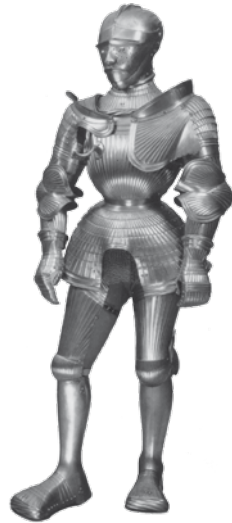
Rüstung Herzog Ulrichs

Im Hintergrund: Beginn der Bannandrohungsbulle Papst Leos X. gegen Martin Luther, 1520