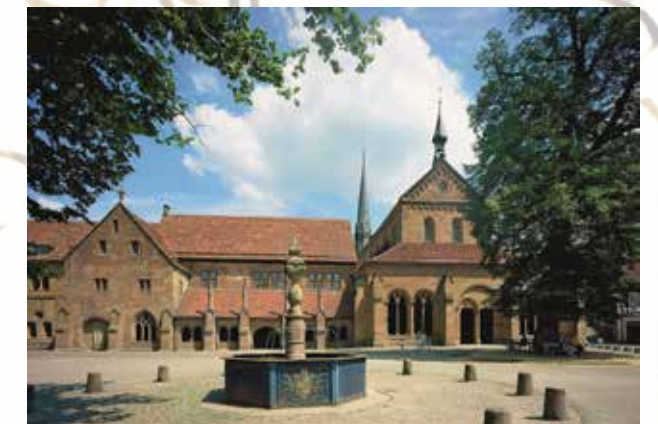
Das Kloster Maulbronn